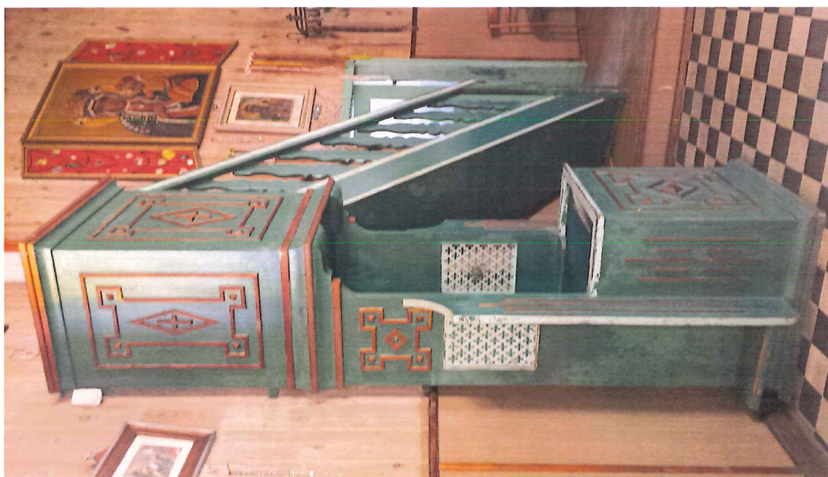
Fot. 2. Ambona z konfesjonalem przed konserwacją- widok na boczną ściankę.